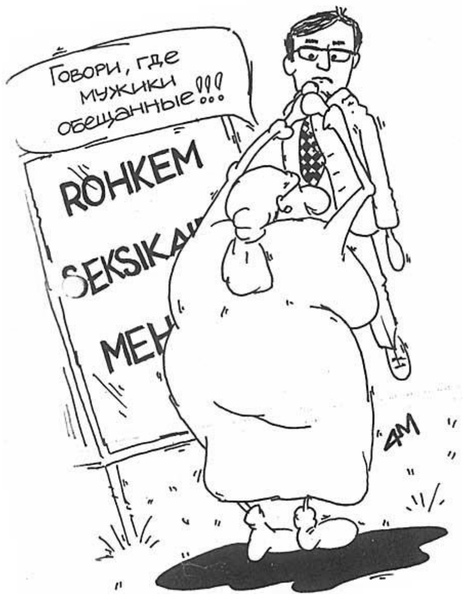
Andres Varustin: Lõppvaatus. Maaleht, 18. september 2003