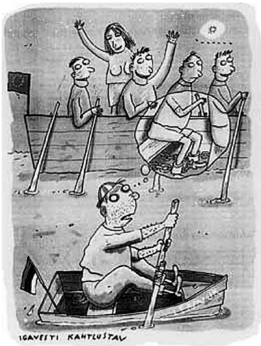
Aimar Juuse: Tulumaksuveto. Äripäev, 21. november 2003