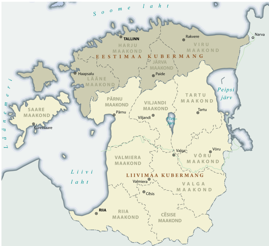
Eestimaa kubermang ja Liivimaa kubermang – haldusjaotus.

Ei tule kellelegi uudisena, et Tallinnas mõeldakse Tallinna-moodi. Riigieelarve ja isegi linna volikogu valimissüsteem on tehtud lähtudes sellest, kuidas kehtiv linnavalitsus kas maha kangutada või võimule tsementeerida. Lihtne näide on diislikütuse aktsiisi tõstmine, mis