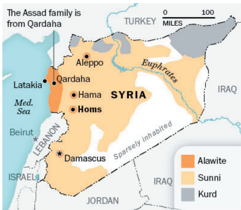
Ethno-religious groups in Syria (population 22 million)

Venemaa õhuoperatsioonis Süürias kokku kuus raskepommitajat Tu-160, 14 Tu-22M3 ja 6 Tu-95MSM; rindepommitajad 12 Su-24M2 ja 8 uut, 20. märtsil 2014 Vene õhujõudude relvastusse võetud pommitajat Su-34; 12 ründelennukit Su-25SM; hävitajatest 4 Su-30SM ja neli uut Su-35S. Peale nende olid operatsiooni kaasatud kaks luurelennukit – Il-20M1 ja Tu-214R. Selleks, et demonstreerida maailmale Vene lennuväe võimsust ja lendurite professionaalsust, komplekteeriti Süüriasse saadetavate lahingulennukite