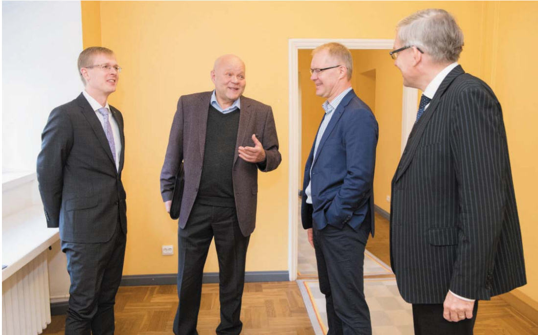
Traditsiooniliselt on kaitsepoliitika olnud erakonnaülese kokkuleppena konsensuslik.