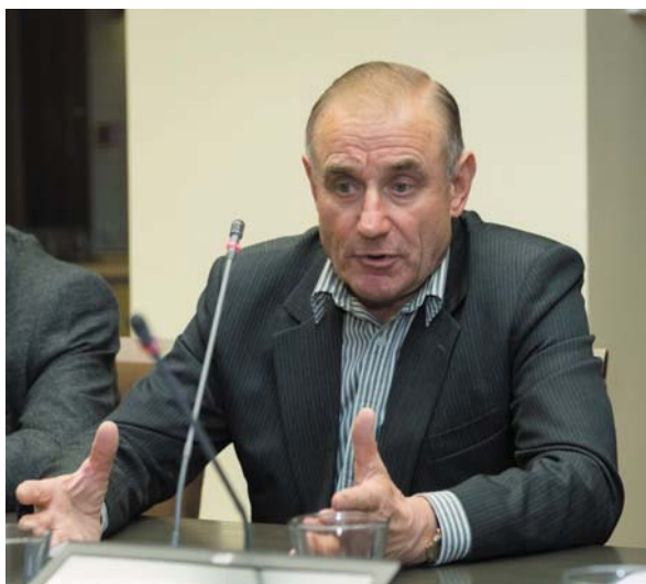
Ants Laaneots (Reformierakond).

ANTS LAANEOTS: Tähendab, mis me välja töötasime 2007–2008, mis oli