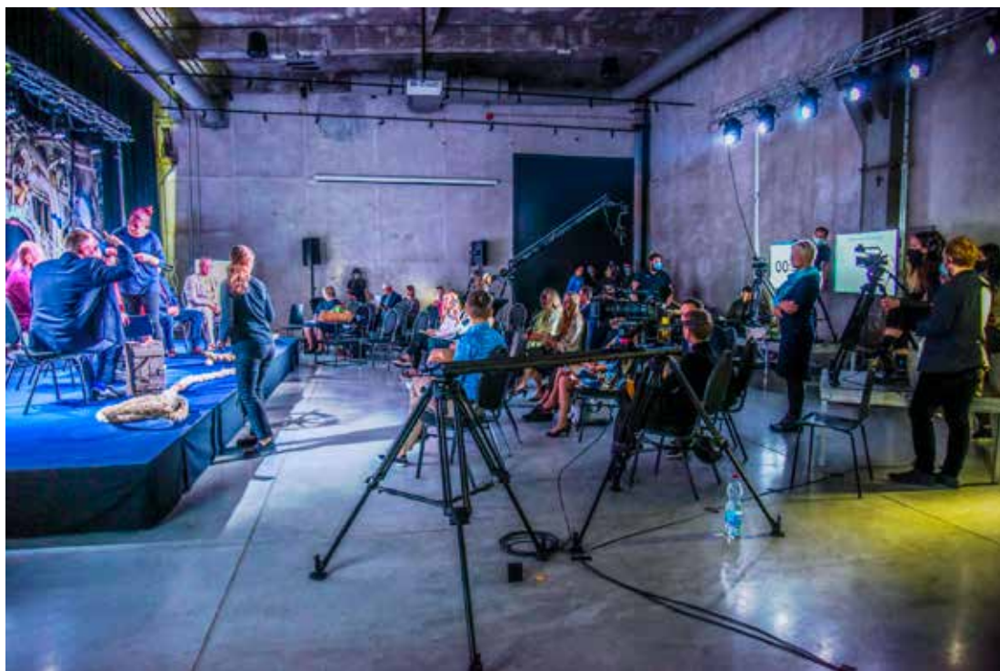
Virtuaalkonverentsil „OSKA ekspeditsioon töö ja oskuste ookeani“ 23. septembril 2020 arutleti tulevikus vajalike oskuste üle. Foto on tehtud konverentsi vahepausil.