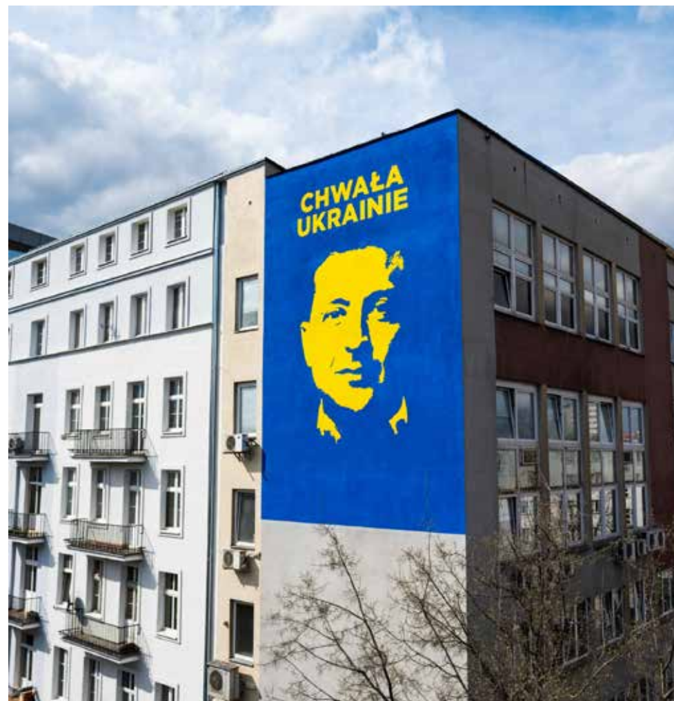
Üks suuremaid Ukraina ja president Zelenskõi toetajaid on Poola.

Ukraina on strateegiliselt läbi mõelnud rohujuure tasandi kommunikatsiooni ja mobiliseerinud sotsiaalmeediasse tuhandeid vabatahtlikke ning pannud ukrainlased terves laias maailmas ühise