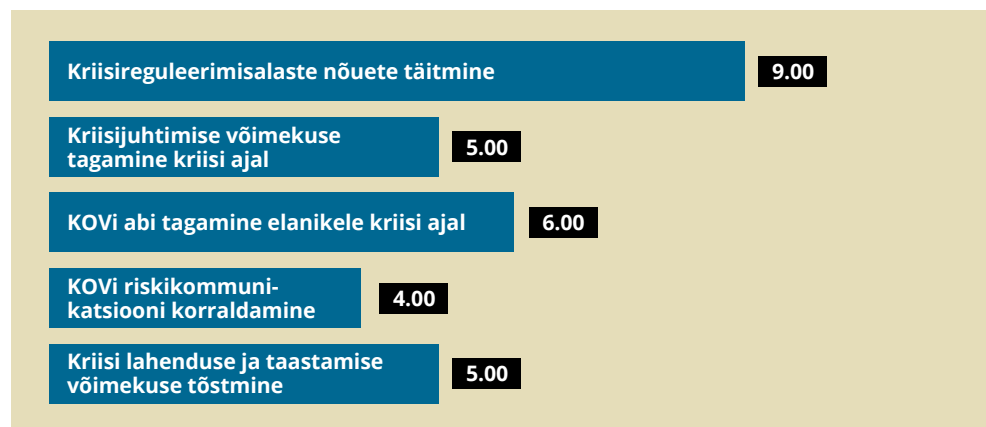
JOONIS 1. Kriteeriumigruppide tase. Omavalitsuste 2020. aasta teenustasemete tulemused.