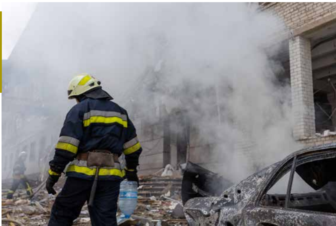
Ukraina päästjad sõjatandril.