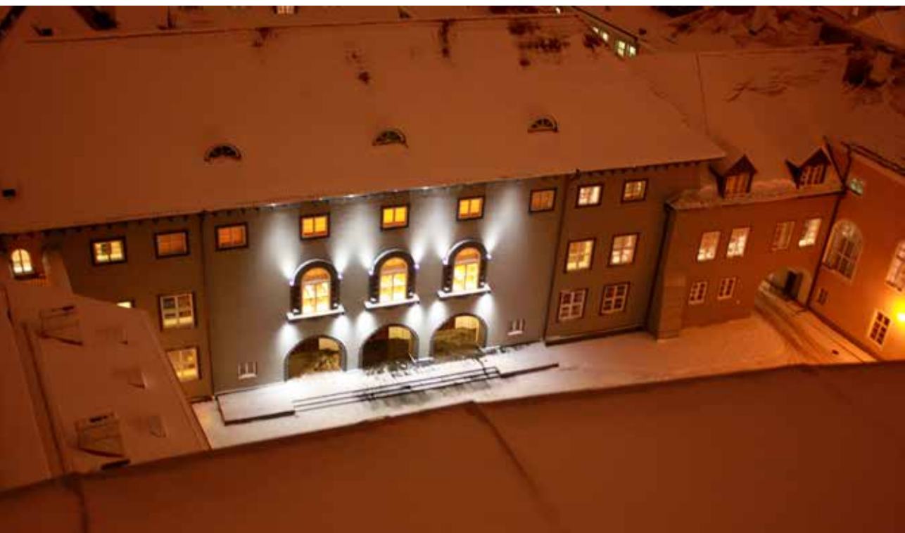
Jüuluuag 2012 Toompeal.