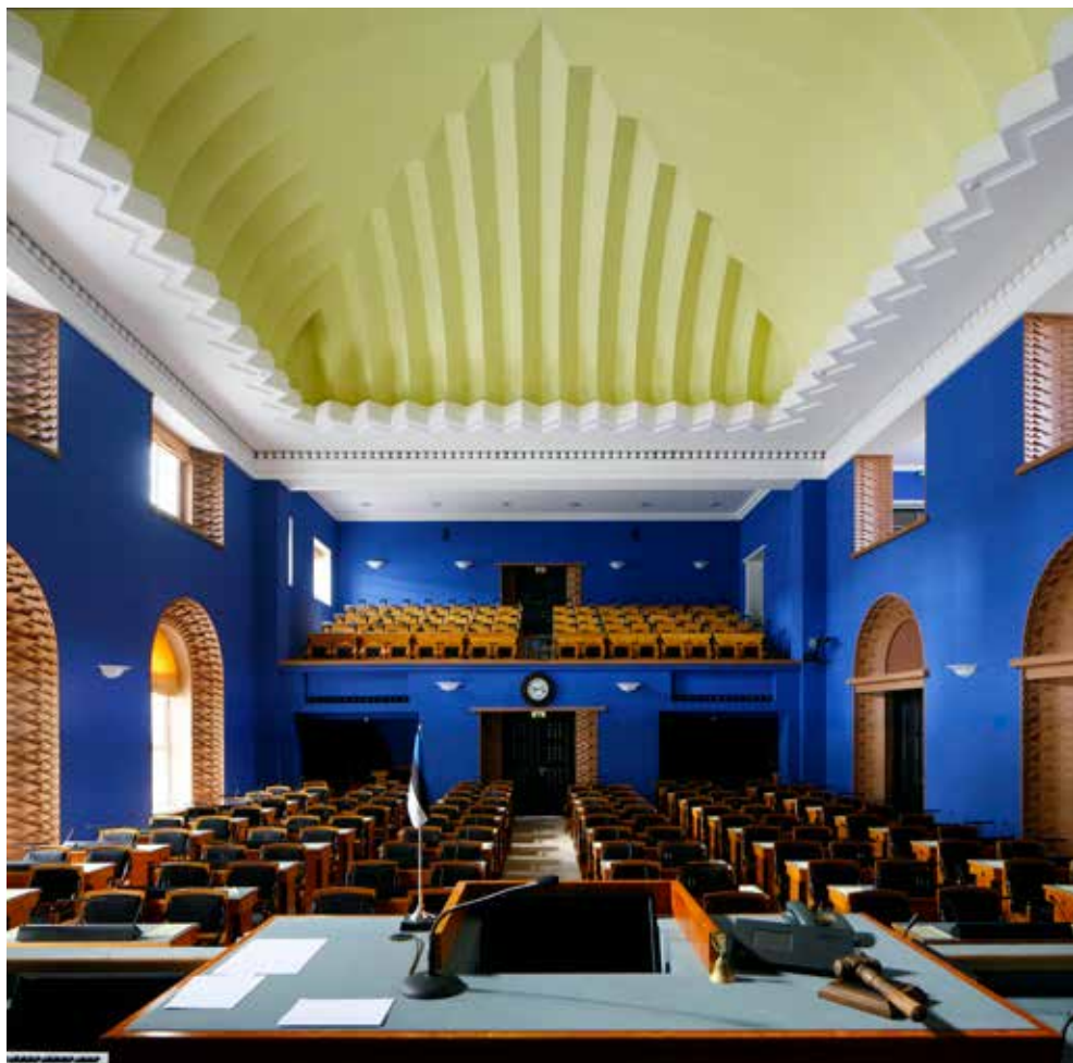
Intensiivsetes toonides istungisaal.